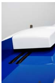
Système alimentation automatique des enveloppes