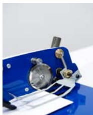
Couteaux auto-affûtant en acier. Réglage de la largeur de la coupe