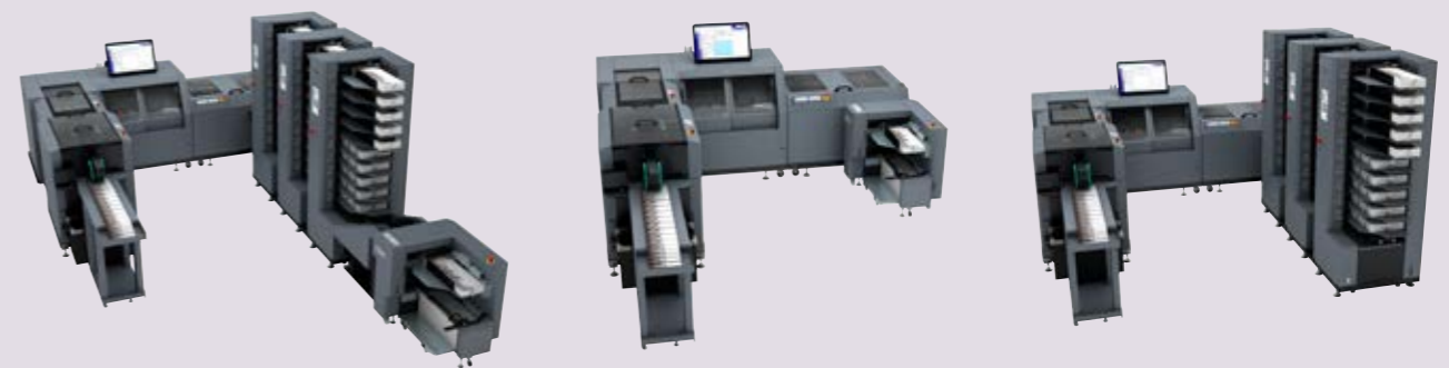
Système iSaddle Duetto