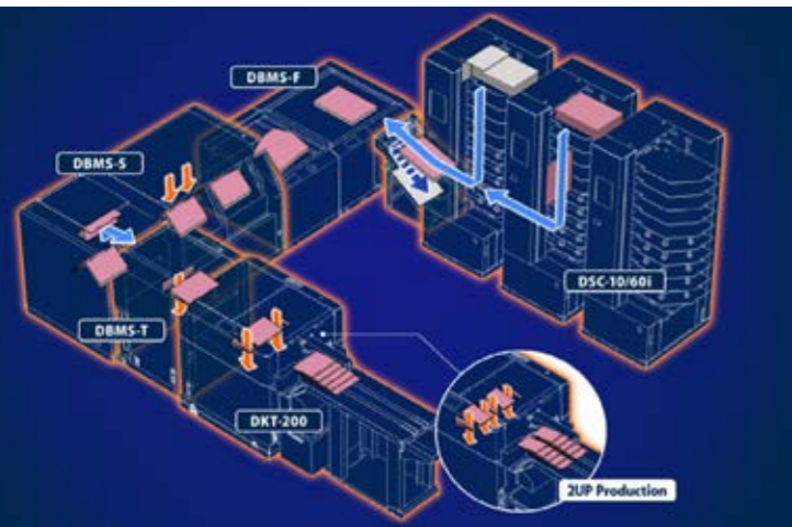
Trajet du papier du iSaddle