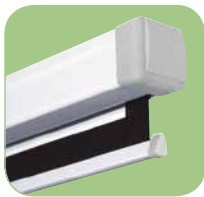
Écran de projection manuel de haute qualité