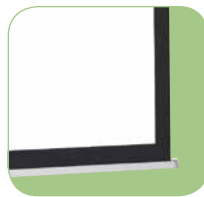
Barre inférieure triangulaire