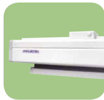
Easy Install avec supports en plastique