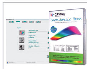
Logiciel SmartWorks EZ Touch