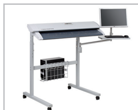
Scanner sur Pied Repro