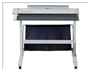
Scanner sur Pied classique avec réceptacle.