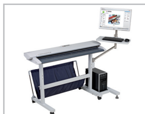
Scanner sur Pied classique avec réceptacle et option support PC / Ecran